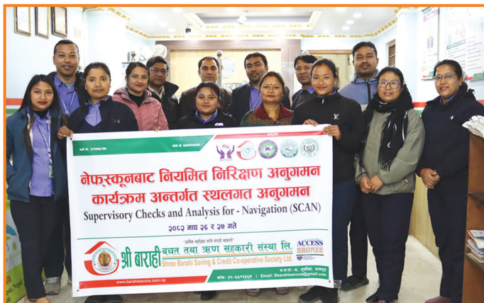
स्वयान कार्यक्रम अन्तर्गतको स्थालगत अनुगमन