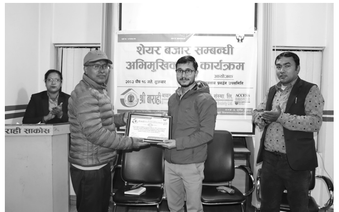
“समुदायको पहिलो छनौटको उत्कृष्ट वित्तीय सहकारी”

उक्त कार्यक्रममा सहभागीहरूले बित्तीय साक्षरता बृद्धि गर्न र अनलाइन मार्फत शेयर कारोवार गर्न आत्मविश्वास बढाउनुका साथै शेयर बजारमा बढ्दो आकर्षणसँगै यस्ता सचेतनामूलक कार्यक्रमले गलत हल्लाको पछि नलागी सही लगानी निर्णय लिन मद्दत गर्ने धारणा तथा प्रतिक्रिया राखेका थिए ।