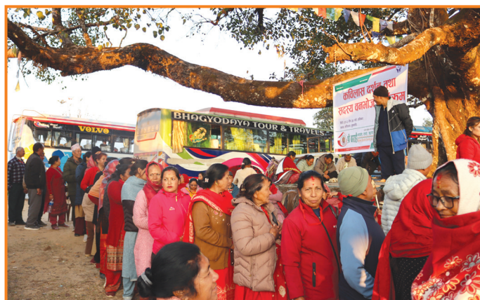
कविलास दर्शन तथा सदस्य बनभोज कार्यक्रम