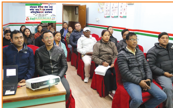
मोवाइल बैकिङ तथा कनेक आइ पि एस सम्बन्धी अभिमुखिकरण कार्यक्रम