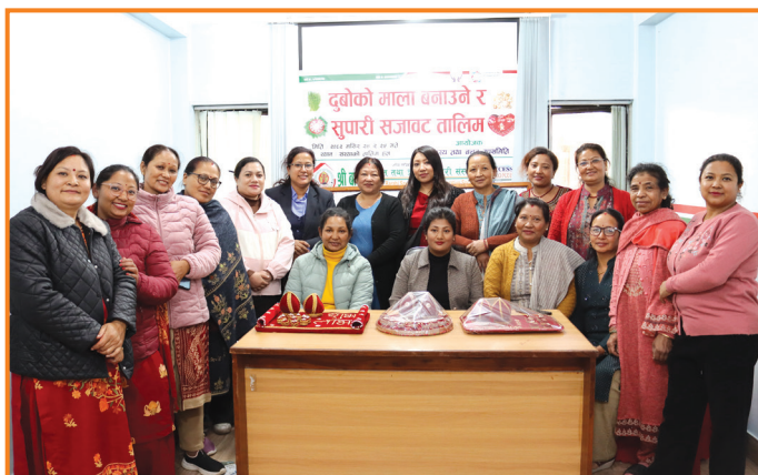
दुवोको माला बनाउने र सुपारी सजावट तालिम